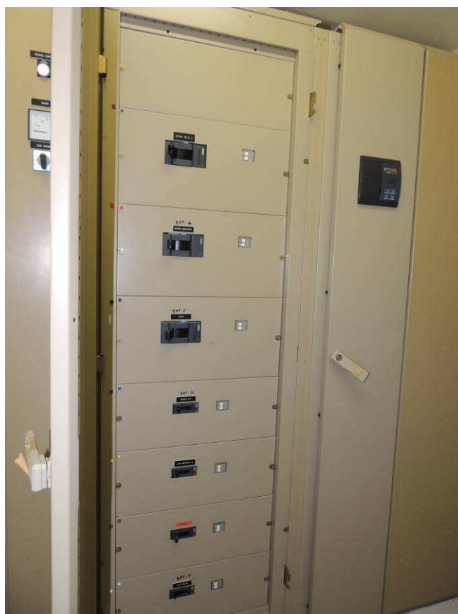
Détail colonne 2 TGBT Bâtiment D - INPT