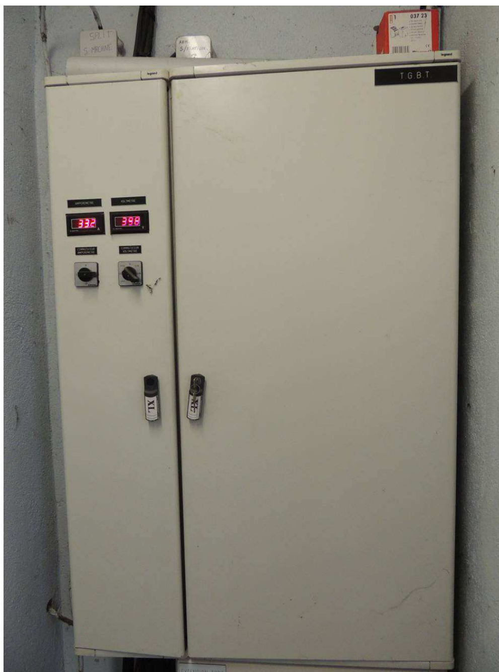
TG Bâtiment G (TGBT G) - INPT