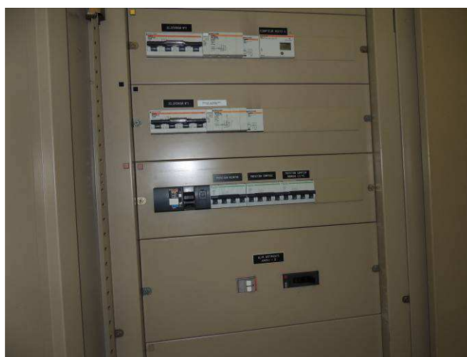
Détail colonne 3 TGBT Bâtiment D - INPT