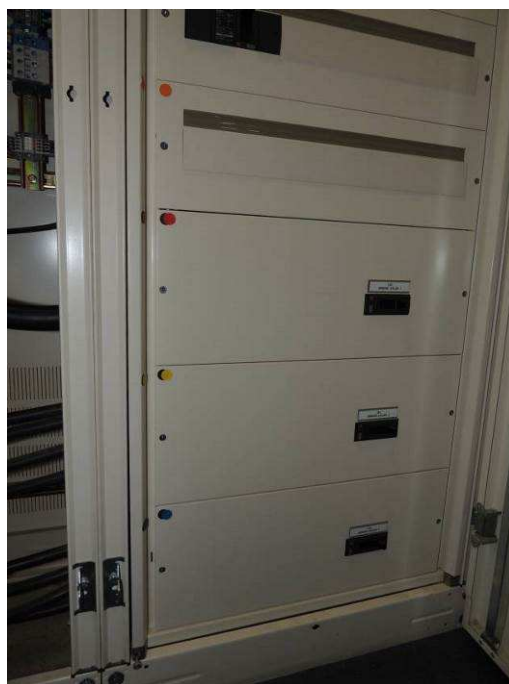
Détail TG Bâtiment E - INPT