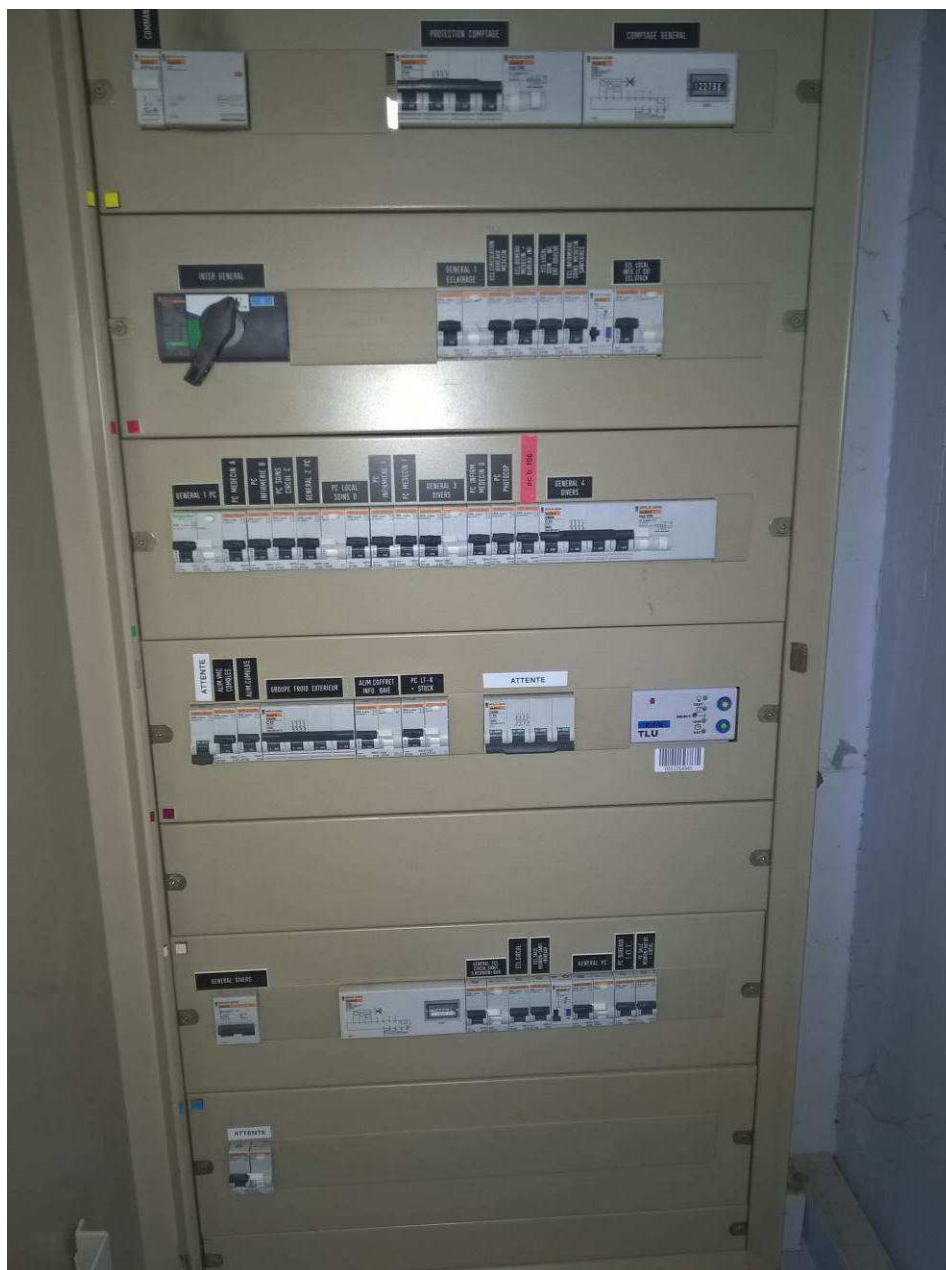
Détail AGBT Bâtiment F – INPT