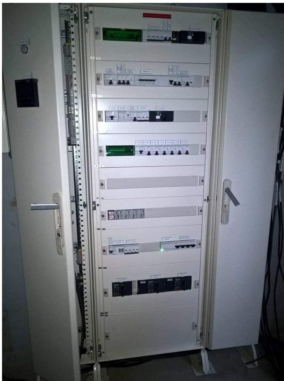
Détail AGBT Bâtiment C LAPLACE – INPT