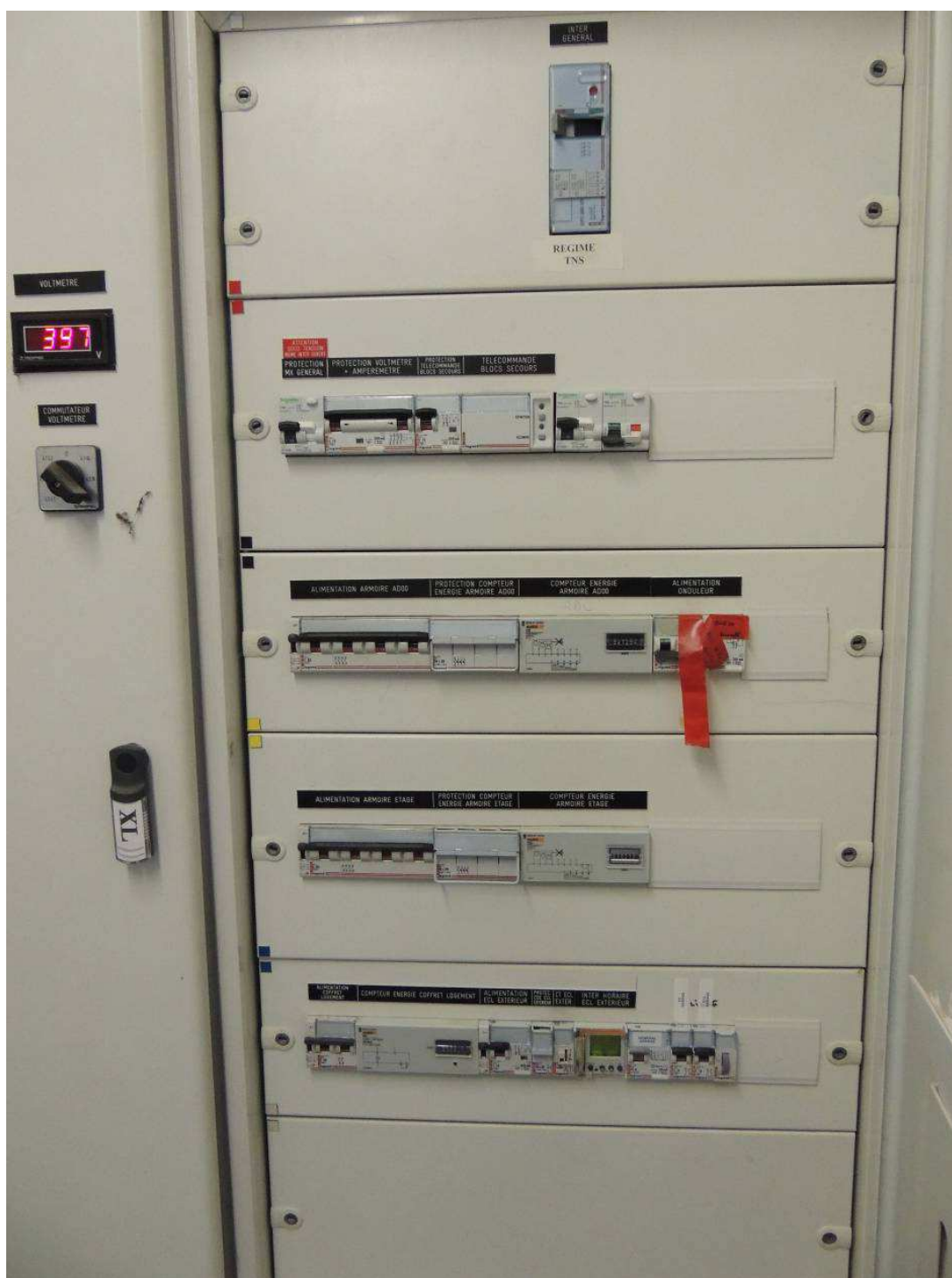
TG Bâtiment G (TGBT G) - INPT