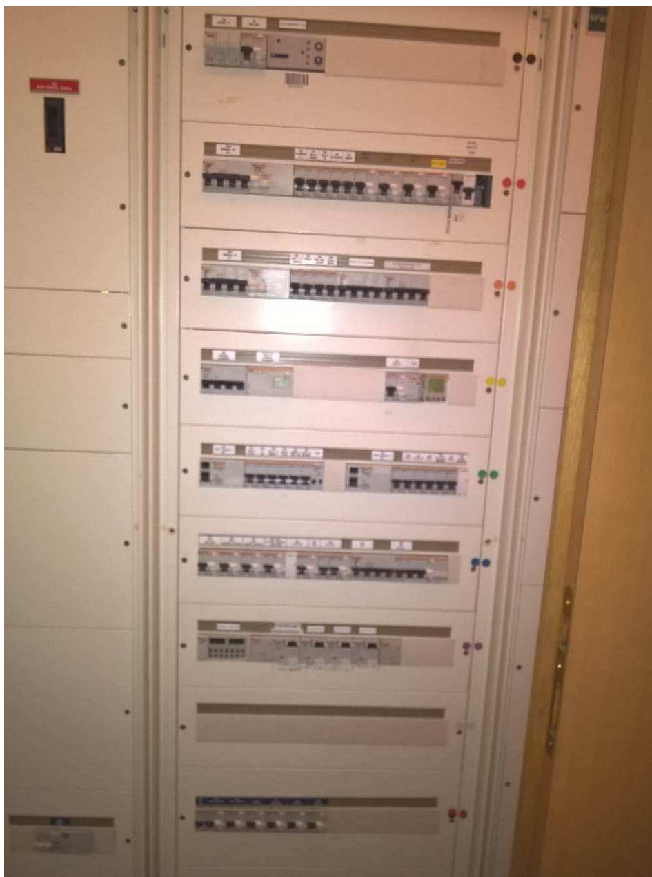
Détail AGBT Bâtiment H – INPT