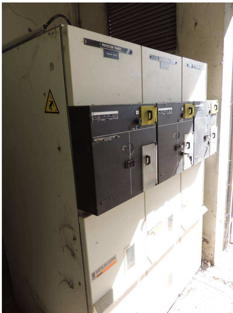
Cellule HTA et transformateur Bâtiment D - INPT