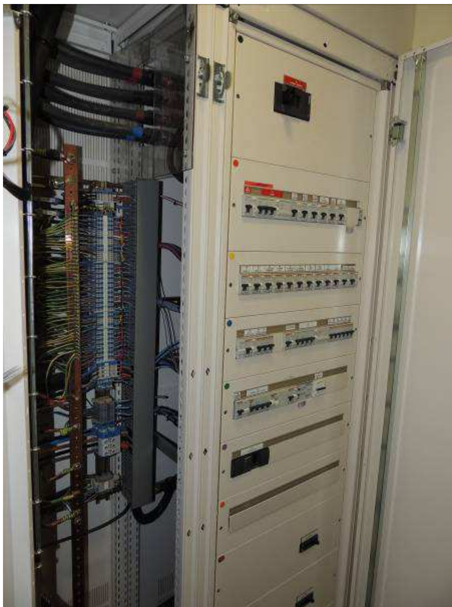
TG Bâtiment E - INPT