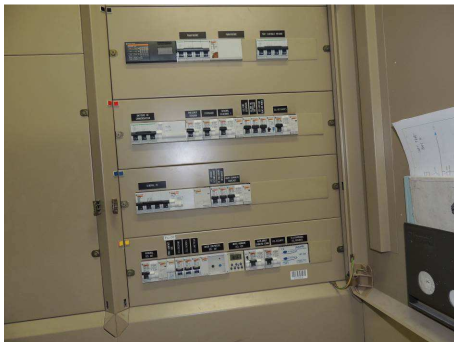
Détail AGBT Bâtiment A – INPT