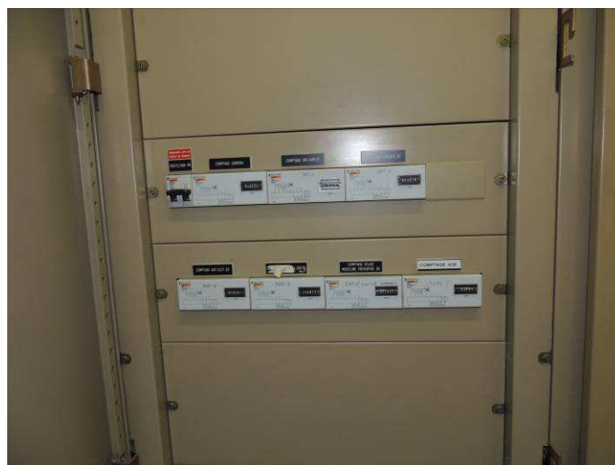
Détail colonne 1 TGBT TGBT Bâtiment D - INPT