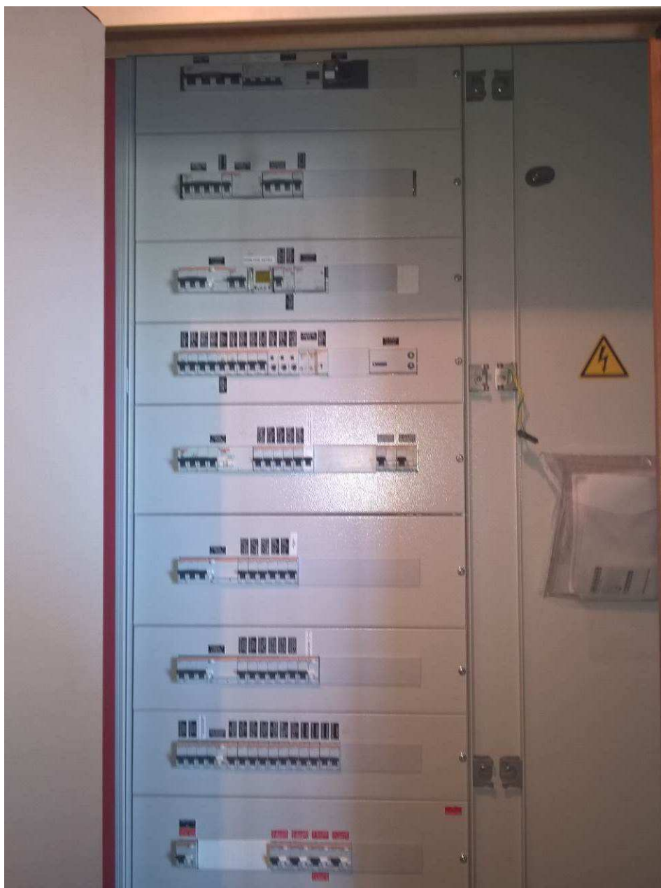
Détail AGBT Bâtiment ICSI (J) – INPT