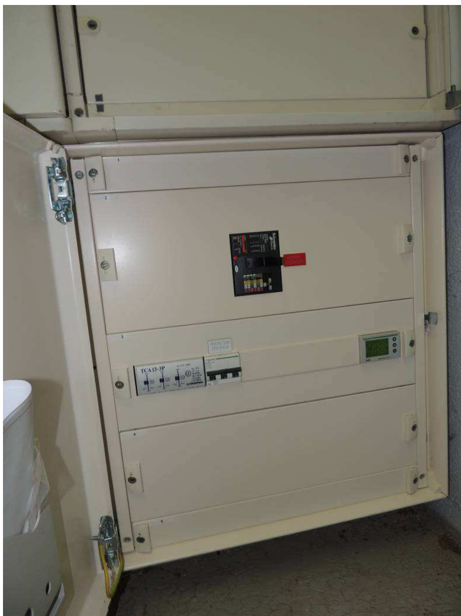
Détail TG Bâtiment G (TGBT G) - INPT