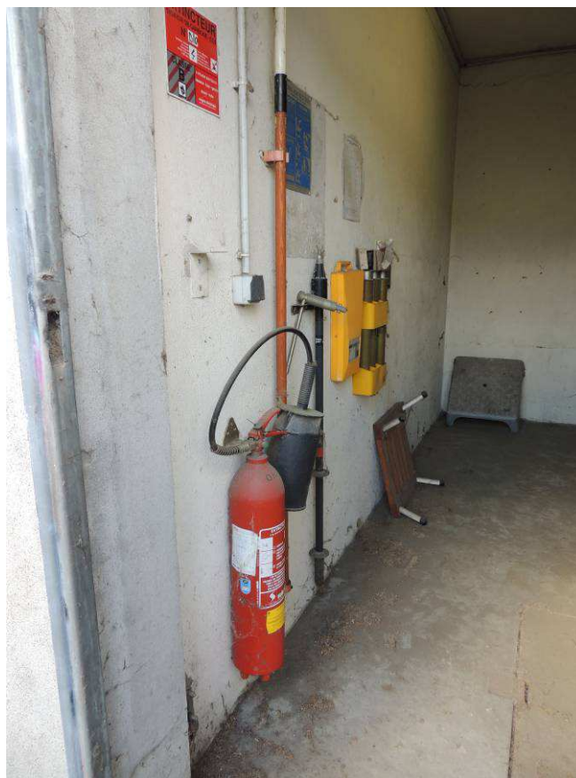
Détail local HTA /BT Bâtiment D - INPT