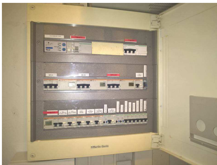
Détail AGBT Bâtiment ACCUEIL – INPT