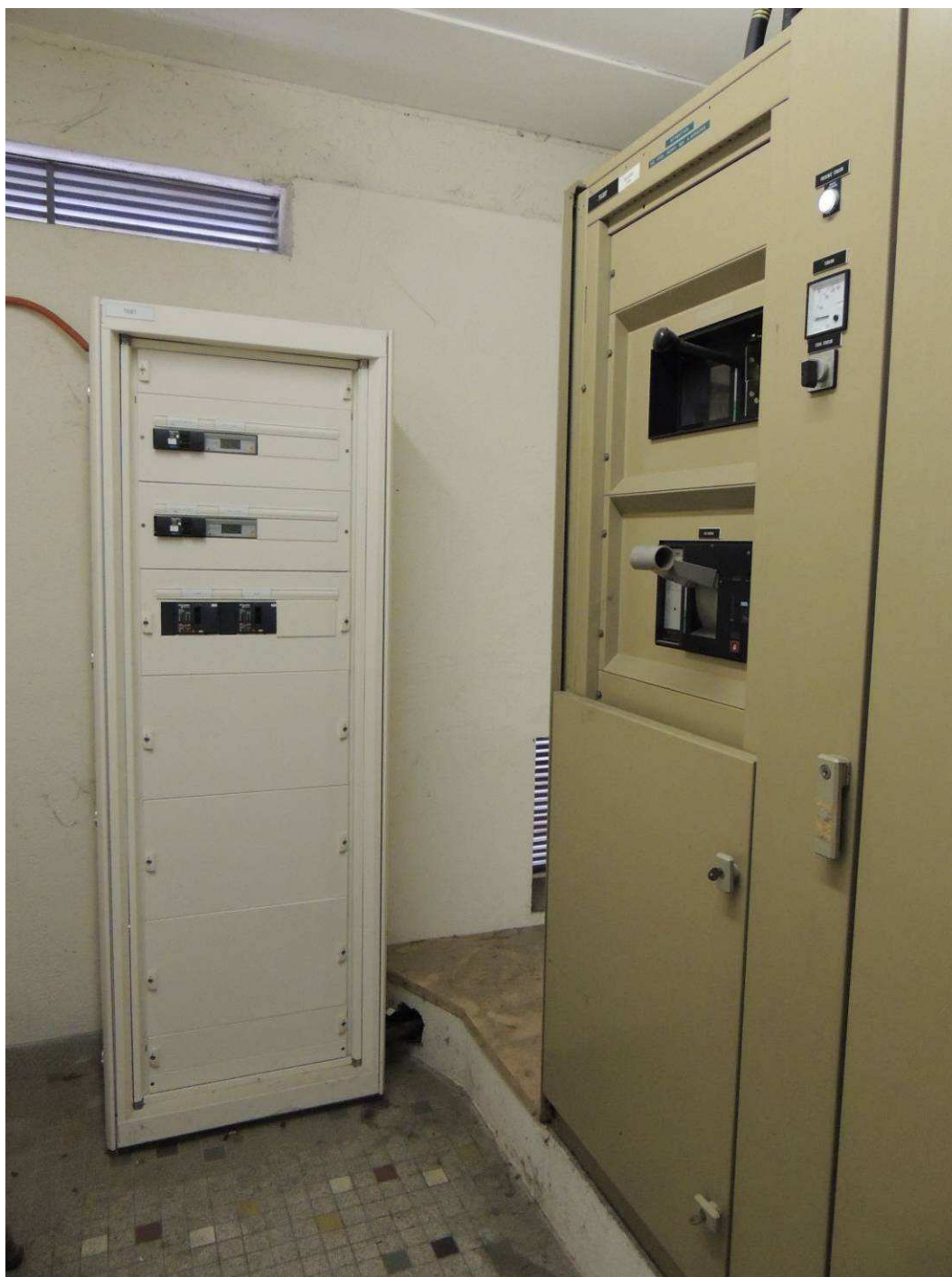
TGBT et EXTENSION TGBT Bâtiment D - INPT